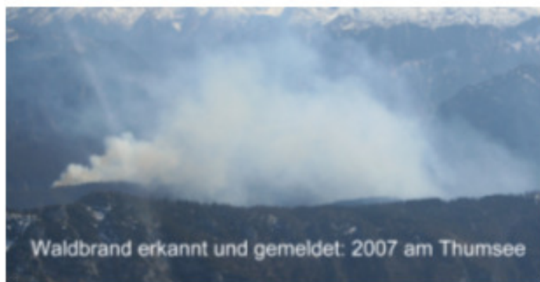
Waldbrand erkannt und gemeldet: 2007 am Thumsee

Grundidee war und ist, die bei den Luftsportvereinen verfügbaren Kleinflugzeuge für eine Luftbeobachtung zu nutzen und so flächendeckend Gefahren und Schadensfälle frühzeitig zu erkennen, Rettungskräfte am Boden für Hilfeinsätze mit leistungsfähigen Funkgeräten zu alarmieren und diese auch aus der Luft zum Schadensort zu führen.